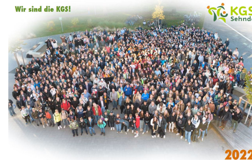
Schülerinnen und Schüler der KGS

Den besonderen Anforderungen kommen wir durch gezielte Unterrichte entgegen. Gerne können Sie uns in diesen Fällen direkt ansprechen.